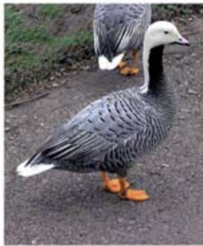
Fot. 45 Śnieżyca cesarska ( Anser canagicus )

Jeden z piękniejszych gatunków z rodzaju Anser . Gniazduje na wybrzeżu Morza Beringa, na północnym wschodzie Azji, północnym zachodzie Ameryki Północnej i Wyspie Świętego Wawrzyńca. Zimuje na wybrzeżu Oceanu Spokojnego i na Aleutach.