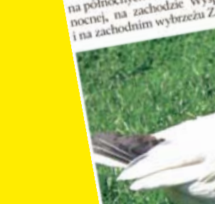
Fot. 44 Śnieżyca

Tereny lęgowe gatunku znajdują się na północnych krańcach Ameryki Północnej, na zachodzie Wyspy Banksa i na zachodnim wybrzeżu Zatoki Hud-