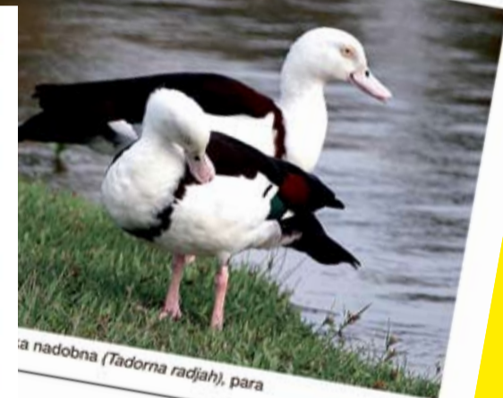
Kazarka nadobna ( Tadorna radjah ), para

Osobniki obojga płci ubarwione jednakowo. Głowa, szyja, pierś, boki