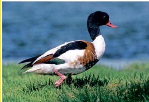
Fot. 63 Ohar ( Tadorna tadorna ), samica

Gatunek ubarwiony bardzo kontrastowo. Na czysto białym tle głowa i górna część szyi czarne z zielonym metalicznym połyskiem. Na grzbiecie dwa podłużne czarne pasy, zachodzącym na grzbiet, tworzącym obręcz. Sterówki białe z czarnymi końcami. Na brzuchu podłużny, czarny pas łączący kasztanową obręcz na piersi z rdzawymi piórami podogonowymi. Na skrzydłach brązowozielone, błyszczące lusterko. Nogi cielistoczerwone, dziób koralowy. W okresie lęgowym, u nasady górnej części dzioba samca, tworzy się duża, wypukła narośl.